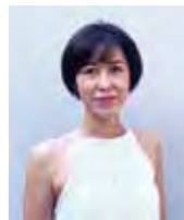
船津丸インストラクター