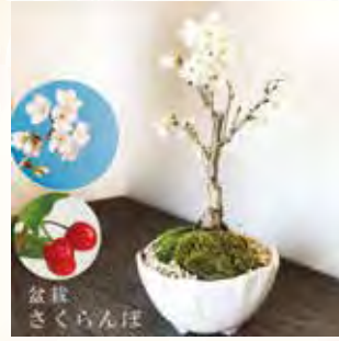
イメージ (鉢は変更となります)

申込方法 1月22日(月)までにサービスセンターへ電話でお申し込みください。*先着順に受付します。 申込時に、会員番号・事業所名・参加者名・日中の連絡先電話番号をお伝えください。