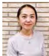
石関インストラクター