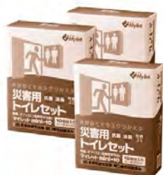
マイレットmini10(災害用)3箱セット