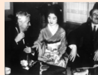
喜劇王チャップリンも訪れた老舗です。