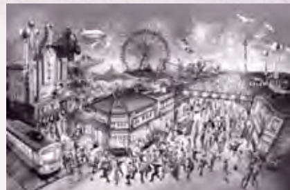
TM & © TOHO CO., LTD. © TEZUKA PRODUCTIONS