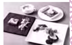
フランセーズランチ イメージ