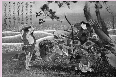
《為朝図》 葛飾北斎 一幅 江戸時代 文化8年(1811) 大英博物館 1881, 1210, 0.1747