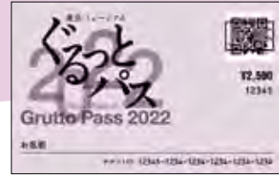
ぐるっとパスカードのイメージ

東京を中心とする美術館・博物館等の入場券や割引券がセットになったお得なQRコードチケット