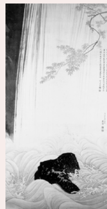
青楓瀑布図 円山応挙 一幅 江戸時代 天明7年(1787) サントリー美術館

ここに大きな滝の絵「青楓瀑布図」があります。江戸時代の絵師・円山応挙の名品として、その写実性も見どころですが、この絵をどこに飾ると素敵か、そこがどんな空間になるかを想像するのも楽しみのひとつです。本展では、何をどう鑑賞したら良いのか悩める日本美術初心者に向け、教科書では教えてくれない日本美術の面白さの一端をご案内します。