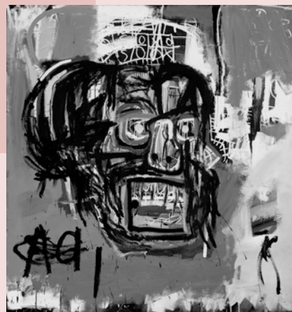
ジャン=ミシェル・バスキア Untitled, 1982 Yusaku Maezawa Collection, Chiba