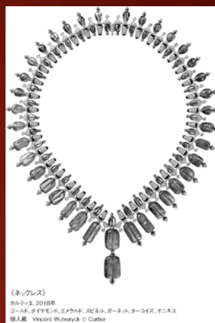
(ネックレス) カルティエ、2018年 デザイナー: ヴィンセント・ワルヴェック、エミリア・タウコフ、タウコフズ、ニコラス 個人蔵 Vincent Waluabek © Cartier