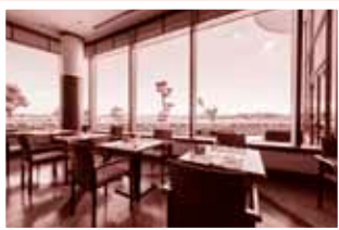
buffet・ダイニング「オーシャンテラス」

その他 ・ツアーには、添乗員・バスガイドとサービスセンターの職員が同行します。 ・旅行日の5日前から取消料が発生いたします。