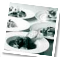
デュオ フルシェット

注) グラスコートは、平日(月～木)と金・土・日・祝日の料金が異なります。金・土・日・祝日を利用の場合は、別途1,000円を現地にてお支払いください。 ※税・サービス料込