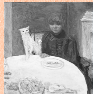
ピエール・ボナール 《猫と女性 あるいは 餌をねだる猫》 1912年頃 油彩、カンヴァス 78x77.5cm オルセー美術館