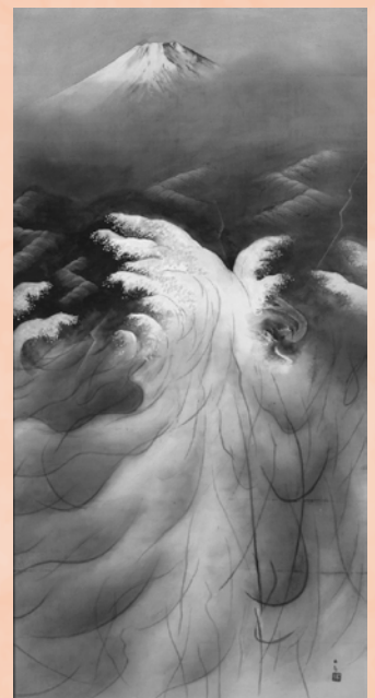
《或る日の太平洋》1952(昭和27)年 東京国立近代美術館蔵