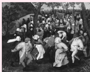
ピーテル・ブリューゲル2世 《野外的な婚礼の踊り》 1610年頃 Private Collection