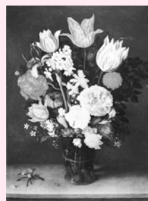
ヤン・ブリューゲル1世と2世 《机上的花瓶に入ったチューリップと薔薇》 1615-1620年頃 Private Collection