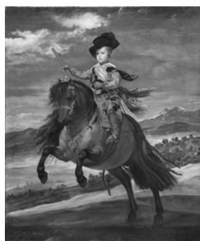
ディエゴ・ベラスケス 《王太子バルタサル・カルロス騎馬像》 1635年頃 マドリド、プラド美術館蔵