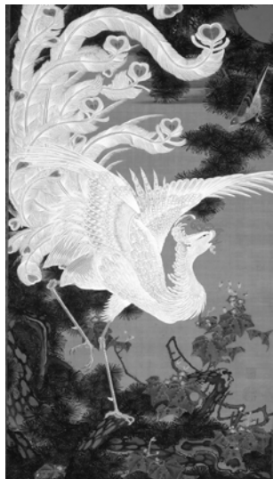
《動植綵絵 老松白鳳図》絹本着色 一幅 141.8×79.7cm 宮内庁三の丸尚蔵館