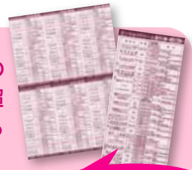
この1枚が割引券です

都内10区と多摩地区の 18団体で計10万人を超 える会員が利用できる 券へとリニューアル