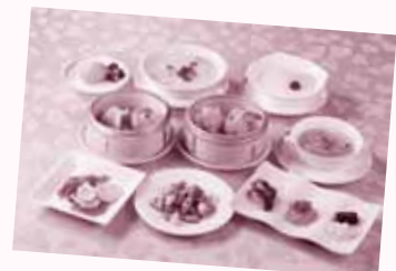
写真は、イメージです。

料金 通常料金3,000円のところ 会員 2,000円 一般及び5枚以降 2,600円