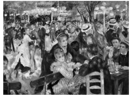
《ムーラン・ド・ラ・ギャレットの舞踏会》 1876年 油彩、カンヴァス オルセー美術館

*中学生以下は無料 *障がい者手帳等をお持ちの方とその付き添いの方1名は無料 *高校生無料観覧日については、追って公式サイト等で発表します。