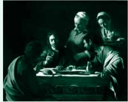
カラヴァッジョ《エマオの晩餐》1606年、 油彩/カンヴァス、ミラノ、ブレラ絵画館

*中学生以下は無料 *心身に障がいのある方とその付添者1名は無料 (入館の際に障がい者手帳をご提示ください。)