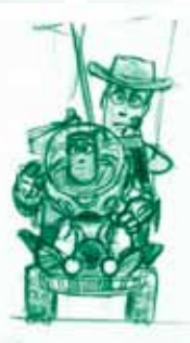
ボブ・ポーリー 《ウッディとバズ》 「トイ・ストーリー」(1995年) 複製(マーカー、鉛筆/紙) ©Disney/Pixar

世界初のフルCG長編アニメーション映画「トイ・ストーリー」から最新作「アーロと少年」に至るまで、映画制作の過程で生み出された美しいアートワークの数々から500点を一挙公開!