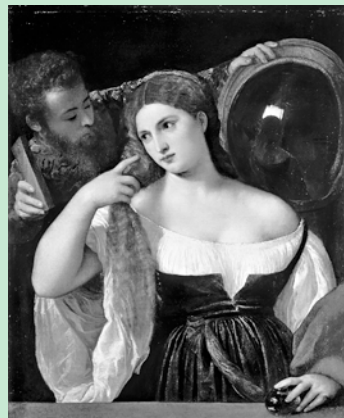
ティツィアーノ《鏡の前の女》1515年頃