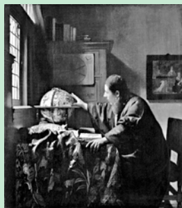
ヨハネス・フェルメール《天文学者》1668年