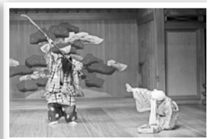
「金藤左衛門」茂山千五郎