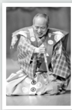
「簸屑」野村万作