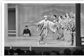
「花折」野村萬斎「簸屑」