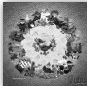
「キルト制作 斉藤謠子」 © Moomin Characters™