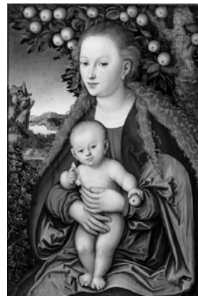
ルカス・クラナハ《林檎の木の下の聖母子》 1530年頃